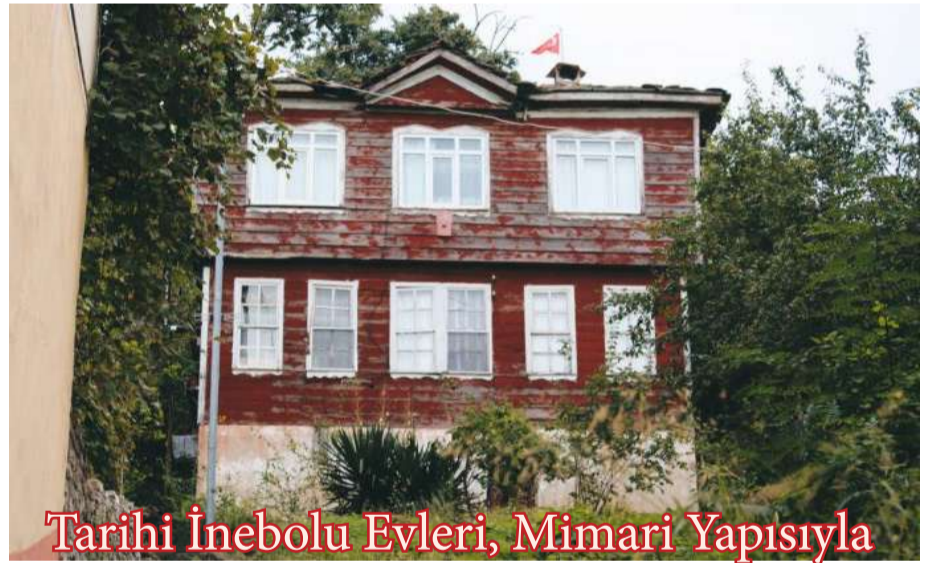
Tarihi İnebolu Evleri, Mimari Yapısıyla Sokaklara Renk Katıyor

tiyatro oyunundaki temel amacın tüm kesimleri afetlere karşı bilinçlendirmek olduğunu vurgulayarak “Biz de AFAD olarak Kastamonu ilimizin koordinesinde görev aldık. Bu oyunun temeli afetler sırasında doğru davranış şekillerine izleyiciye tiyatroyla aktarmak... Bizim kendi eğitimlerimizde de afet farkındalık eğitimlerimizde de bahsettiğimiz konular burada birebir tiyatro sahnesinden seyircilere aktarılıyor...” ifadelerini kullandı.